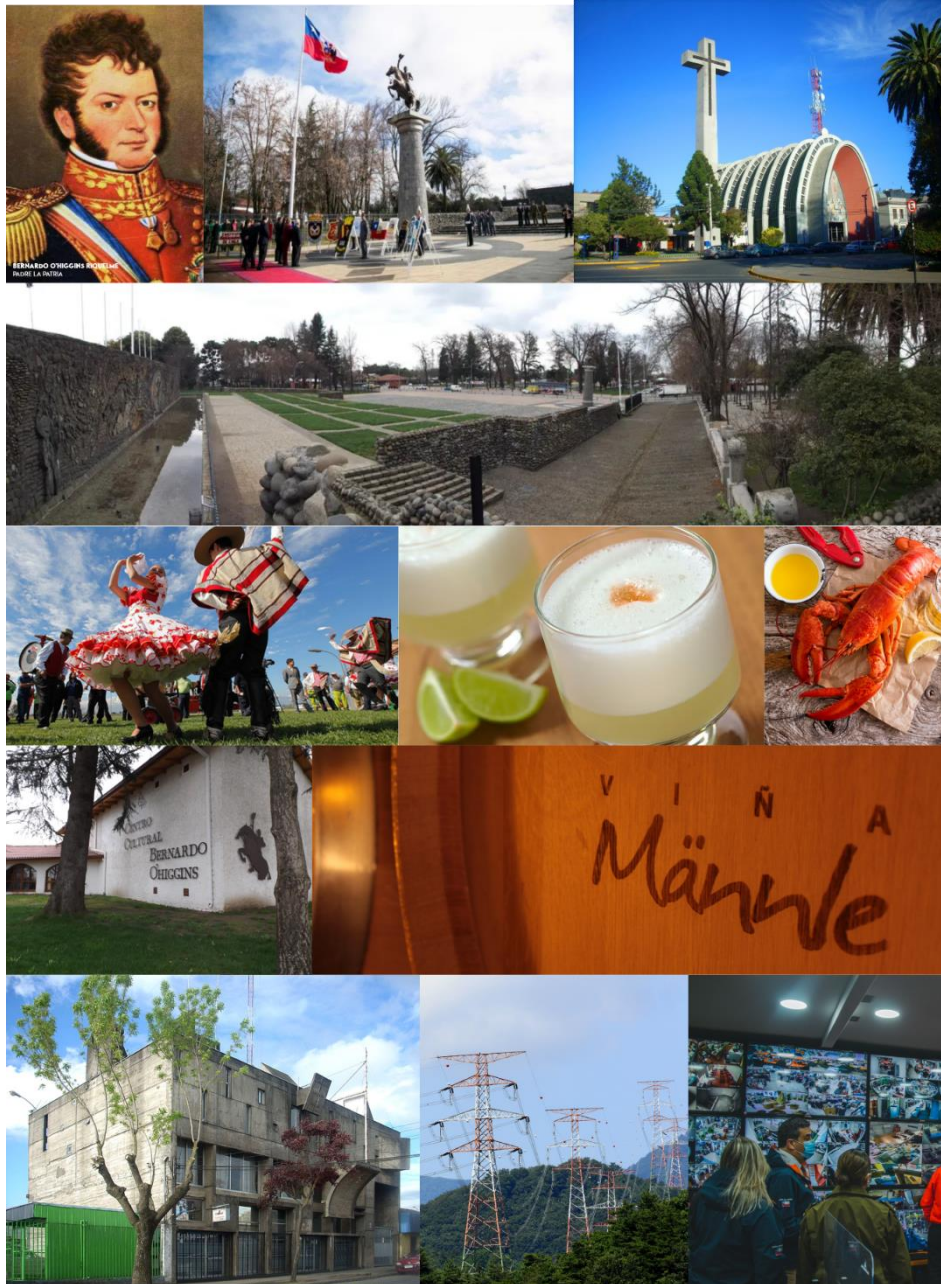
Imágenes y fotos del otro lado de la Cordillera