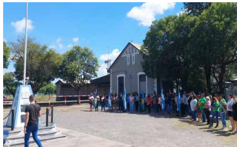
nificativo acontecimiento para nuestra comunidad.